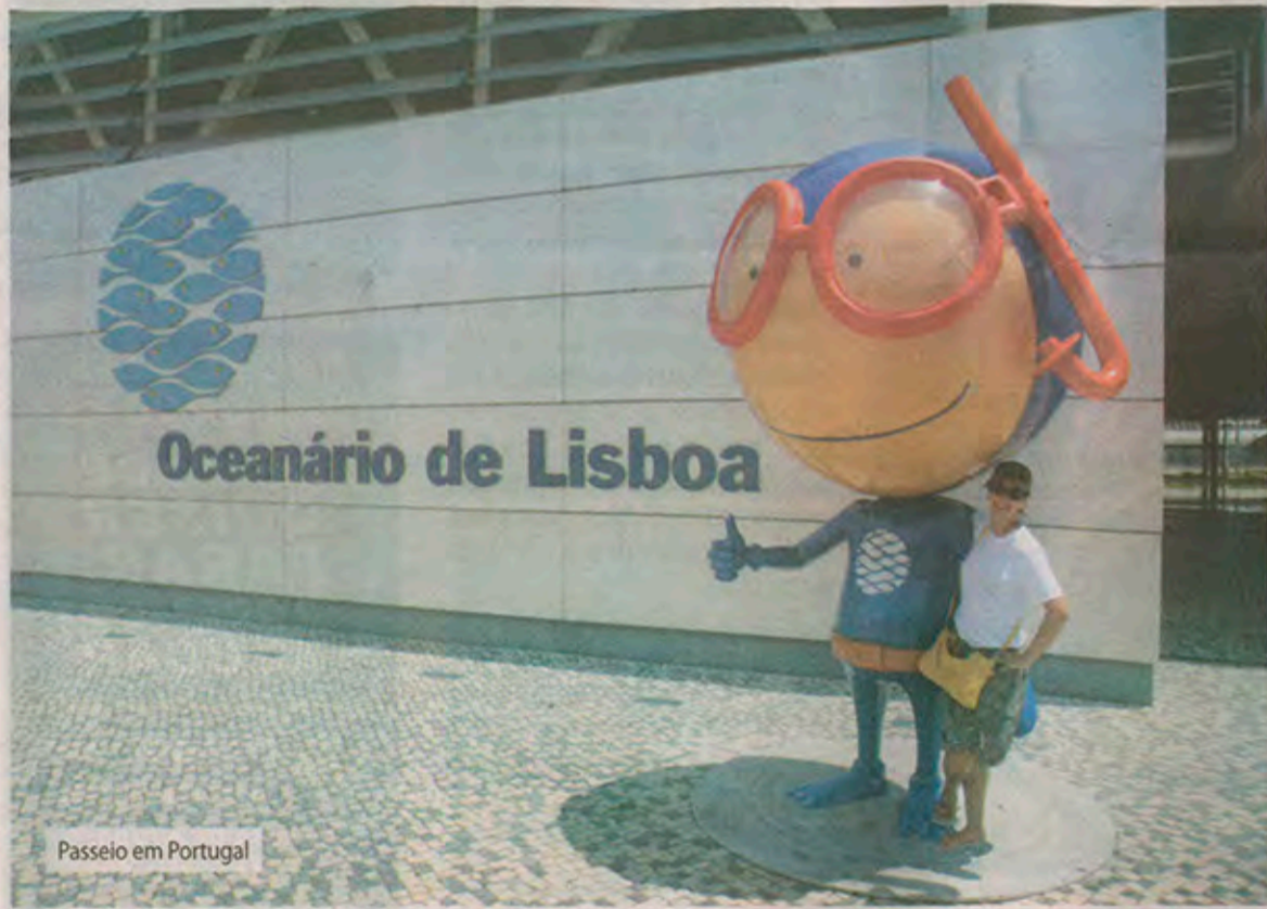
Passeio em Portugal