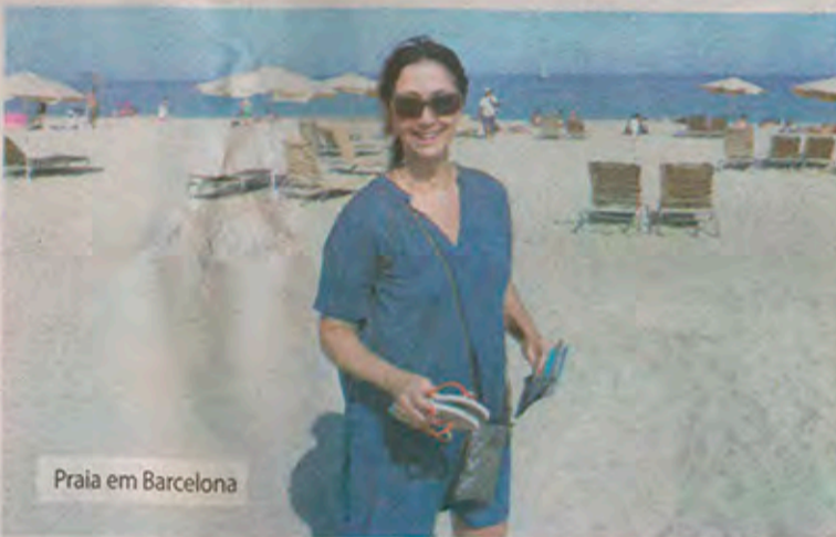
Praia em Barcelona