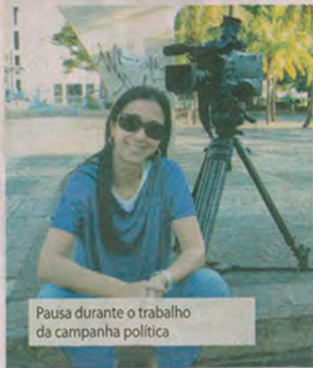
Pausa durante o trabalho da campanha política