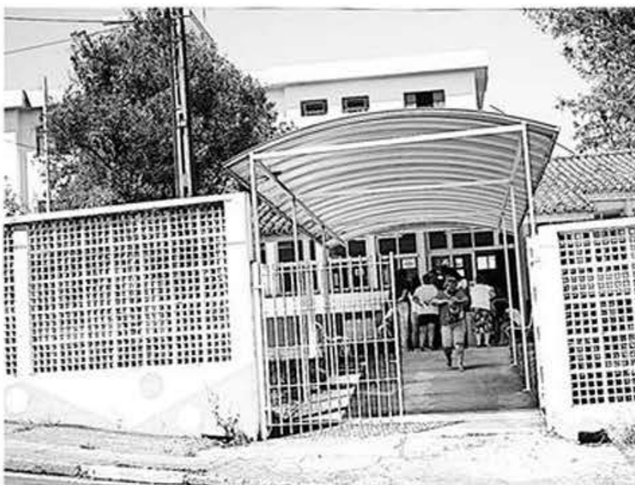
PREVISÃO Unidade de Braz Cubas deve ser reaberta em setembro

dobrar praticamente o tamanho dessa UBS, que passará dos 300 metros quadrados (m 2 ) para 500 m 2 . Serão construídos consultório de ginecologia com banheiro, de odontologia, sala de demonstração em saúde