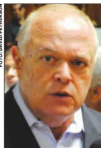
Gondim é o segundo mais bem visto