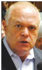
Gondim aposta que o momento é agora