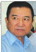
Junji é o principal nome do Grupo

O PR deve apoiar um dos candidatos do GB, haja vista que isso pode-