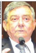
Chico uma incógnita para ser pensada