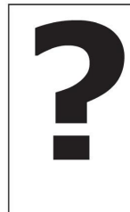
PSOL e PSTU podem lançar candidatos