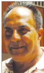
A dúvida é: como ele virá para essa eleição?