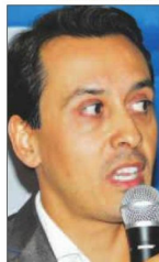
Soares: apoio do PRB, Record e Universal