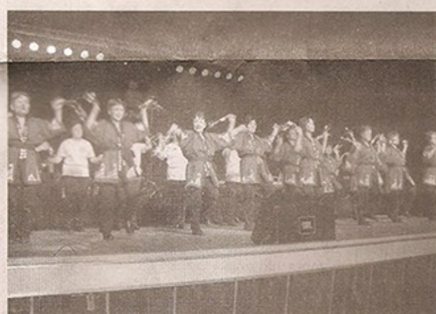
Hanagasa Ondo (Acal)