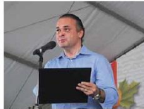
Deputado federal Roberto de Lucena