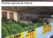
Venda de frutas e verduras direto do produtor