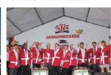
Autoridades e convidados durante o brinde