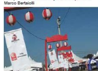
Centro Esportivo recebeu decoração japonesa