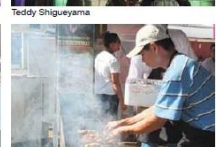
Churrasco: divide espaço com pratos japoneses