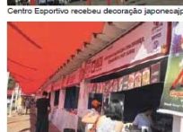
Pavilhão Agrícola de Cultural