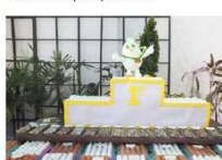
Pavilhão Agrícola de Cultural