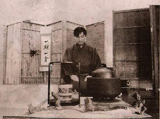
Cerimônia do Chá no Ginásio de Esportes