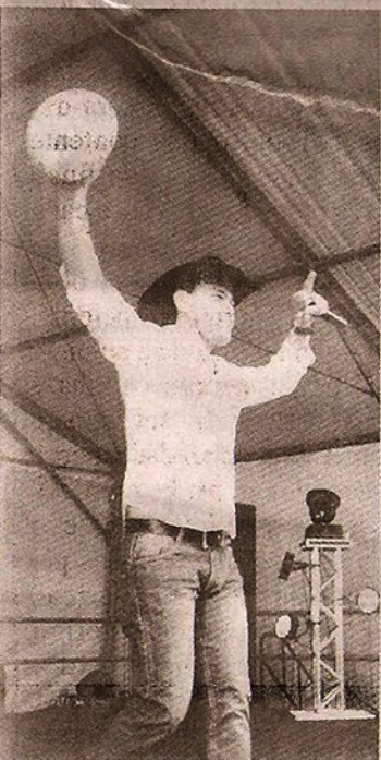
O cantor Joe Hirata agitou o público no domingo