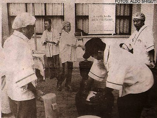
A arte do moti tsuki chamou a atenção