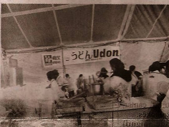
Udon aqueceu o friozinho de São Roque