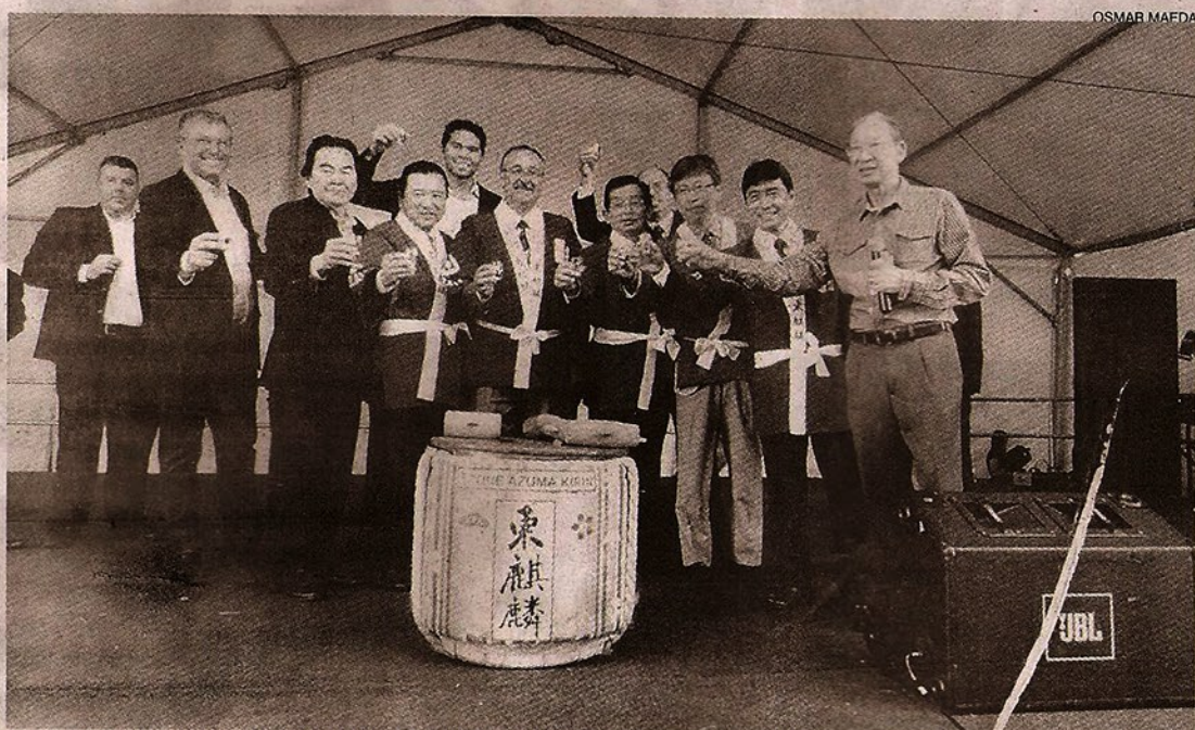
Cerimônia de abertura reuniu deputados nikkeis e prefeitos da região

Novidades – “Ainda bem que o jogo do Brasil foi no sá-