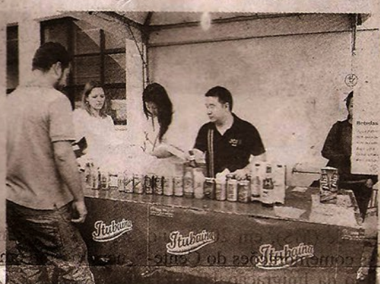
Voluntários da JCI Brasil marcaram presença