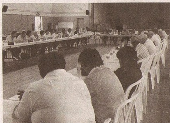
定期役員会の様子

また10月17日には政治「開く予定で、山村会長は選挙後だが、当落選者どちらも参加するだろう」と話した。