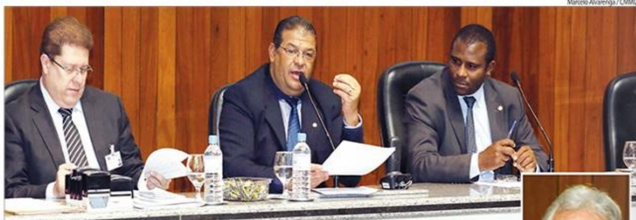
Tema foi discutido pelos parlamentares na sessão de terça-feira, dia 30

NA SESSÃO de terça-feira, 30 de junho, os vereadores defenderam que seja trazida para Mogi a Companhia de Entrepostos e Armazéns Gerais de São Paulo (Ceagesp), que hoje funciona na Vila Leopoldina, na Capital. Embora a vinda da unidade, na iminência de deixar seu atual endereço, seja uma reivindicação antiga, a possibilidade de Suzano pleitear o mesmo motivou as discussões dos vereadores. "Suzano já está na briga pela Ceagesp. Nossa Comissão de Indústria e comércio precisa entrar logo nesta briga. Quem chega na frente bebe a água limpa. Mogi é região privilegiada, com Ayrton Senna, a Rodovia Presidente Dutra. Não é desmerecendo Suzano, mas não podemos ficar de fora. Precisamos