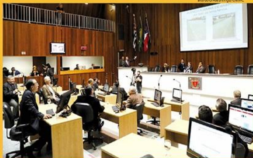
Parlamentares querem pleitear reuniões com a ministra da Agricultura, Kátia Abreu

Na sessão de terça-feira, 30 de junho, os vereadores defenderam que seja trazida para Mogi a Companhia de Entrepostos e Armazéns Gerais de São Paulo (Ceagesp), que hoje funciona na Vila Leopoldina, na Capital. Suzano também quer sediar unidade. Pág. 4