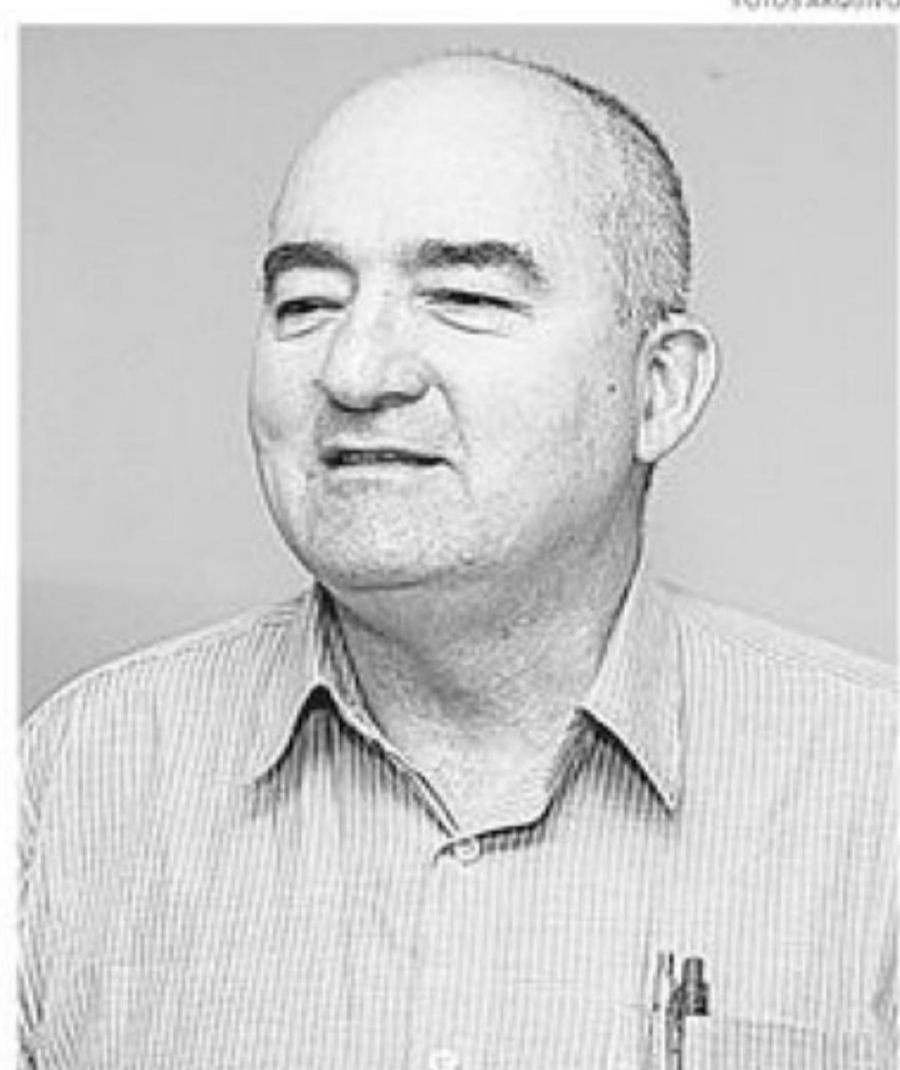
PROPOSTAS Junji incentiva aumento da carga horária em sala de aula; Lapique quer tirar crianças das ruas; Araújo e Mendonça defendem modernização das escolas