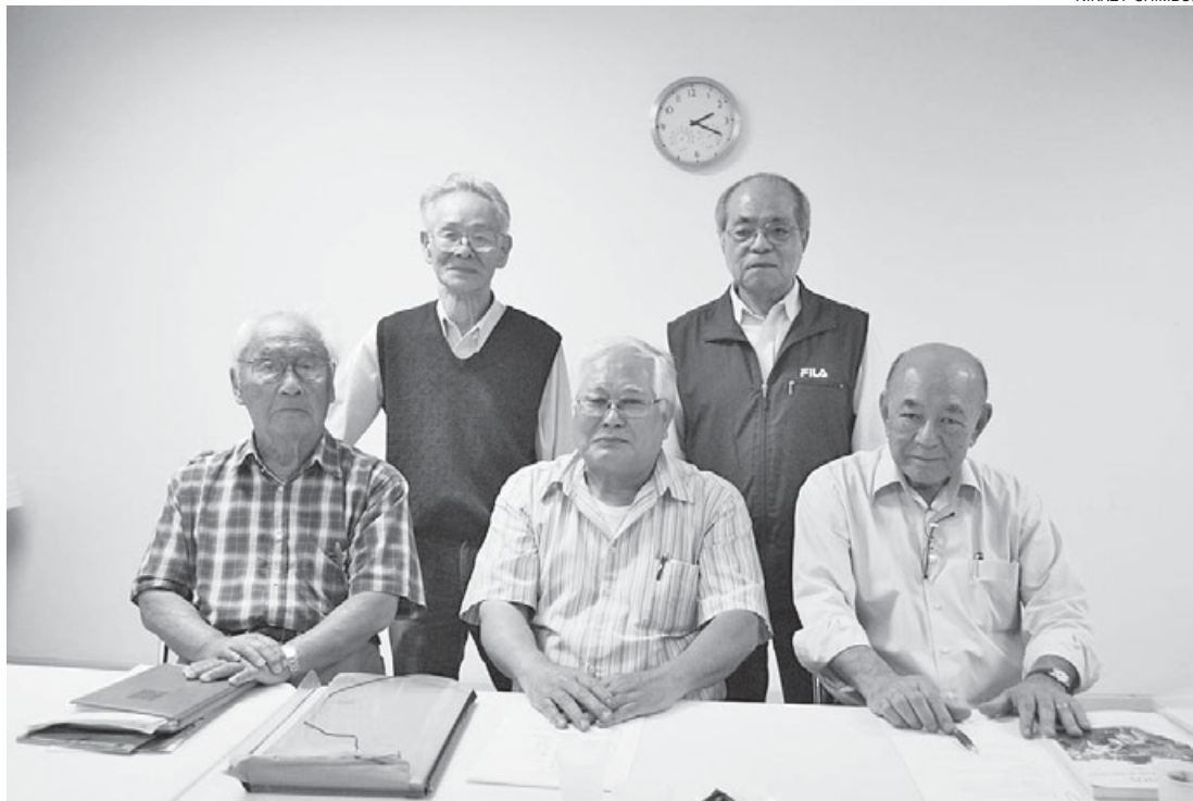
Comissão Organizadora dos Festejos e diretores da associação de Santo André e da matriz