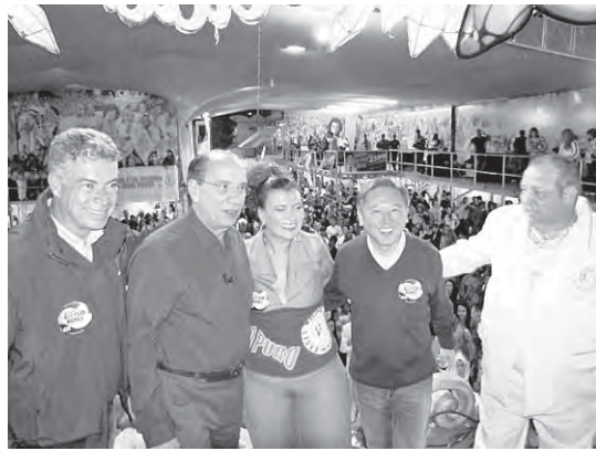
Candidatos com a diretoria da Escola