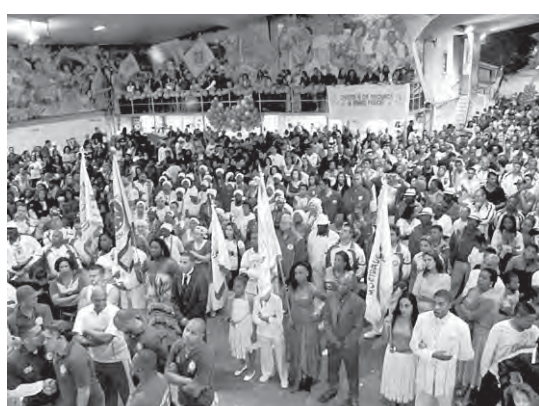
Público acompanhou a votação do samba-enredo 2011

NIPO DE CAMPINAS – Homenagens, lembranças, lágrimas, reencontros e muita emoção, num clima de festa e amizade. Todos, no Jubileu de Prata do Karaokê do Instituto Cultural Nipo-Brasileiro de Campinas, brindaram a data, 29 de agosto, juntamente com os fundadores, ex-presidentes e familiares, voluntários e diretores, mas alguns “in memoriam”. Após a abertura oficial, o 25º Concurso de Karaokê Aiko-kai Nipo Campinas prosseguiu, com a participação de 326 cantores.